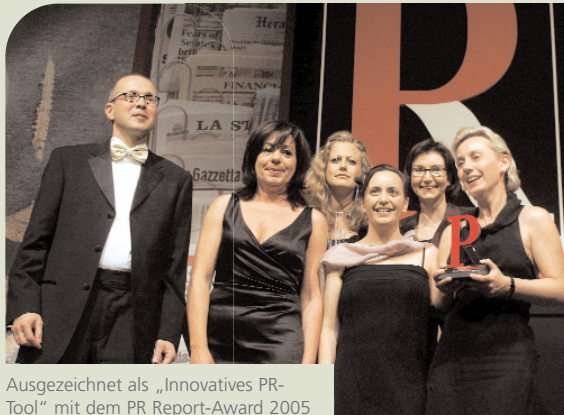
Ausgezeichnet als „Innovatives PR-Tool“ mit dem PR Report-Award 2005